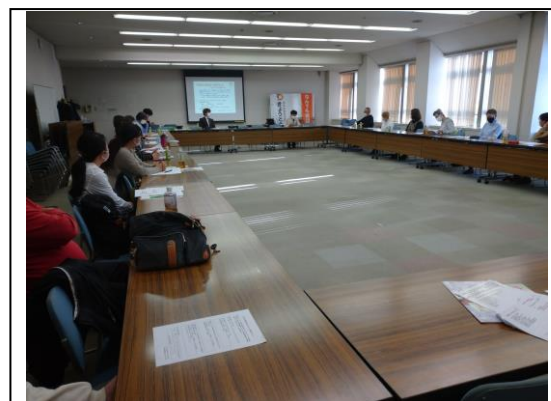
ひがしなだ居場所交流会 2/14 @東灘区文化センター