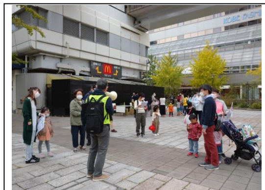
RICファミリーあそびのひろば第1回 10/18 まちあるきツアー